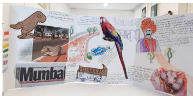
Travail d'un élève de 2nde pro (lycée Charles Péguy à Eysines, 2021). Voyage en Inde