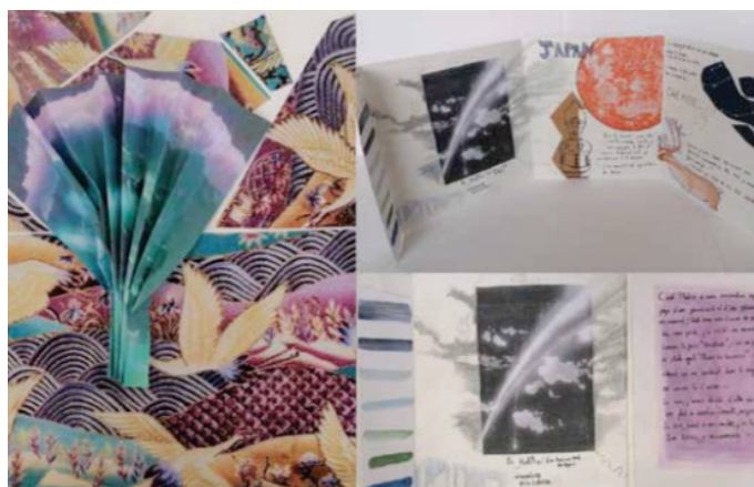
Travail d'un élève de 2nde pro (lycée Charles Péguy à Eysines, 2021).

Voyage au Japon : 1/ la couverture, 2/ l'intérieur avant, 3/ l'avant avec la 6ème page rabattue